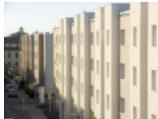
Blick in die Brüderstraße